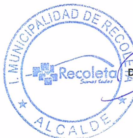
DANIEL JADUE JADUE ALCALDE